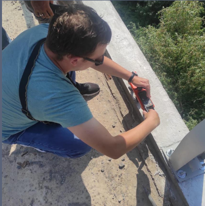
Измерение усилия на вырыв анкерного устройства