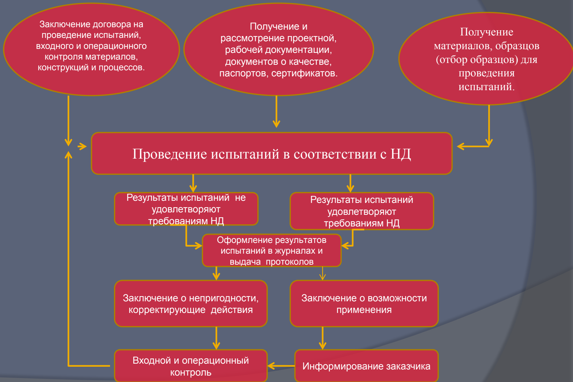
СХЕМА ПРОЦЕССОВ КОНТРОЛЯ КАЧЕСТВА