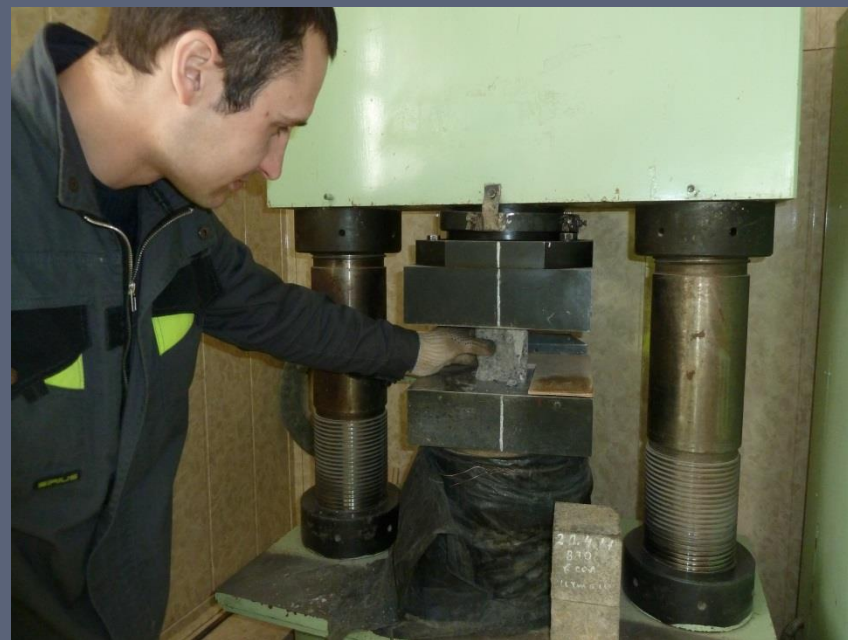
Определение прочности при сжатии