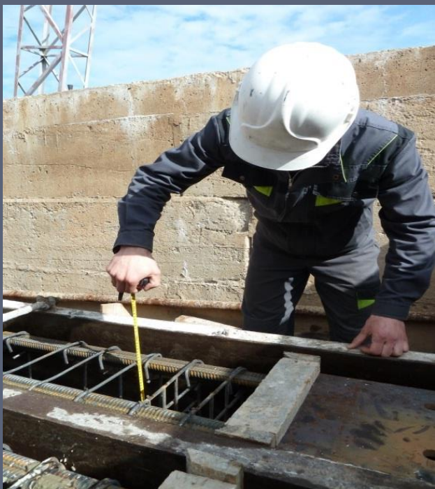
Контроль изготовления ЖБК изделий