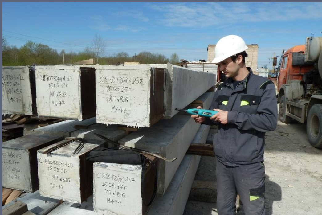
Контроль качества ЖБК